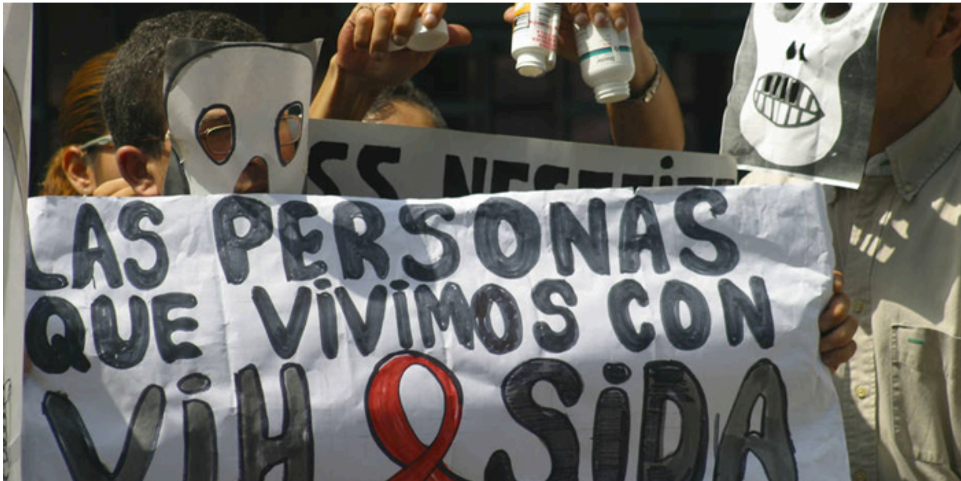
Protesta de personas con VIH en Venezuela