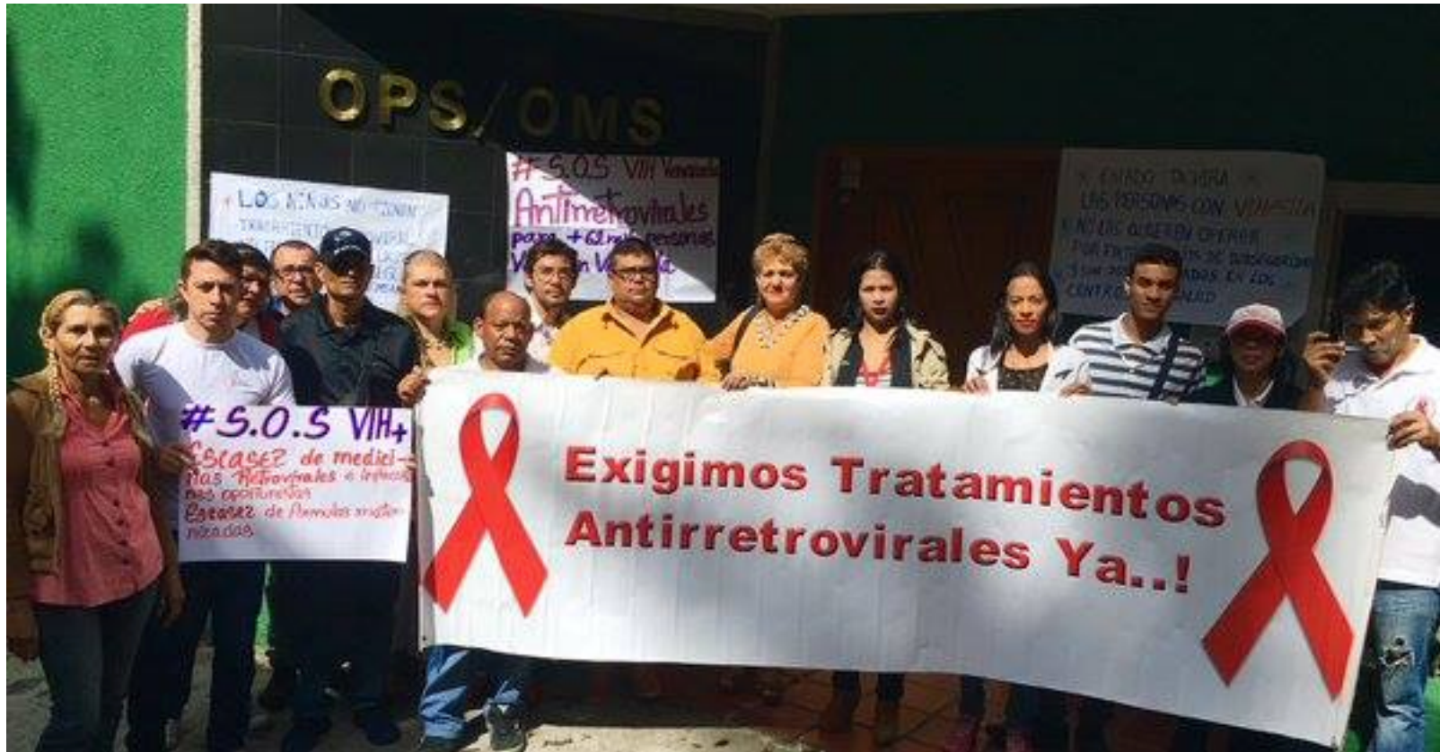
Protesta de personas con VIH frente a la OPS-Venezuela por escasez de ARV