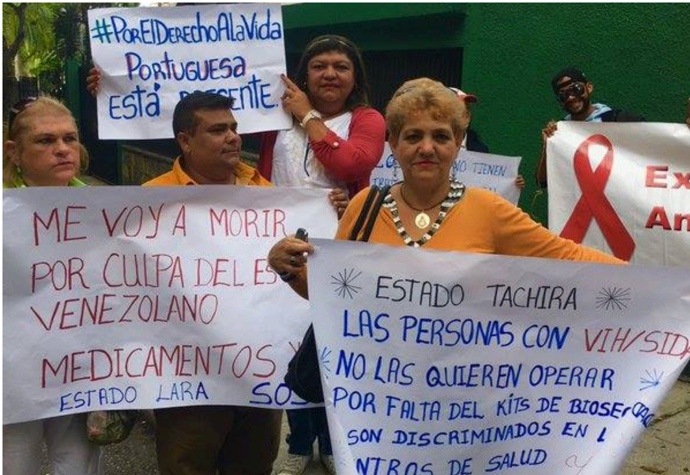
Protesta de personas con VIH frente a la OPS-Venezuela por escasez de ARV