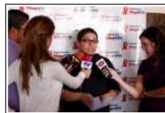
I Cena Benefica

Detalles de ésta y más información, están disponibles en el sitio web oficial de la ONG en www.stopvih.org . Manténgase actualizado, únase a los grupos @StopVIH en las redes sociales de Twitter y Facebook.