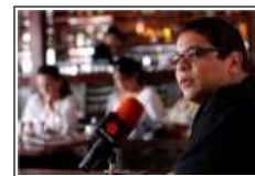
I Cena Benefica