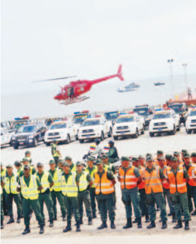
DESPLIEGUE El dispositivo se extenderá por tierra, aire y mar.

tratégicos de Maracaibo como lo son: el terminal de pasajeros, la plazoleta de la Basílica, la Curva de Molina, San Isidro, sector Reyes Mago, Altos de Milagro Norte y Puerto Caballo”, anunció el general de brigada José Gonçalves, jefe del Core 3 de la GNB. En el Zulia y durante la temporada habrá un despliegue de 7.000 funcionarios entre Guardia Nacional Bolivariana, las policías municipal regional y municipales. Estos estarán abocados a todos los lugares donde asiste la mayor cantidad de visitantes, así como a un “ataque” a la ingesta de bebidas alcohólicas, con el fin de hacer respetar las normas de tránsito terrestre. El Zulia contará con 1.210 unidades terrestres entre vehículos y motocicletas, 50 lanchas y cuatro helicópteros para el resguardo.