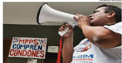
38.000 personas están afectadas por la escasez de los medicamentos

Gutiérrez denunció también la escasez de reactivos para practicar los exámenes de carga viral de VIH y recuentos linfocitarios, test destinados a medir la efectividad de los tratamientos.