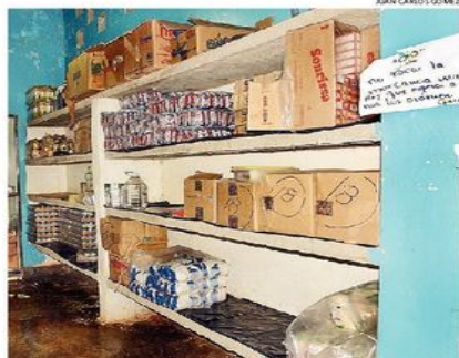
El informe del personal refiere que el suministro de alimentos lo realiza una cooperativa

El representante de los usuarios se basa en un informe del personal que refiere el caso del suministro de alimentos, que realizaba un mayorista privado y ahora está en manos de una coo-