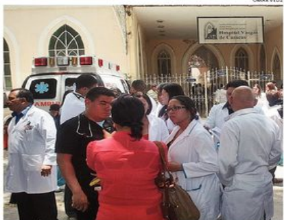
Los médicos se reunieron en asamblea y hoy realizarán otra reunión