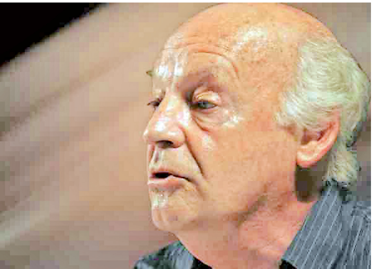
Fernando Vallejo figura entre los candidatos a este galardón.

En los 35 años de existencia que tiene el premio Cervantes sólo en tres ocasiones ha recaído en una mujer, las españolas María Zambrano (1988), Ana María Matute (2010) y la cubana Dulce María Loynaz (1992).