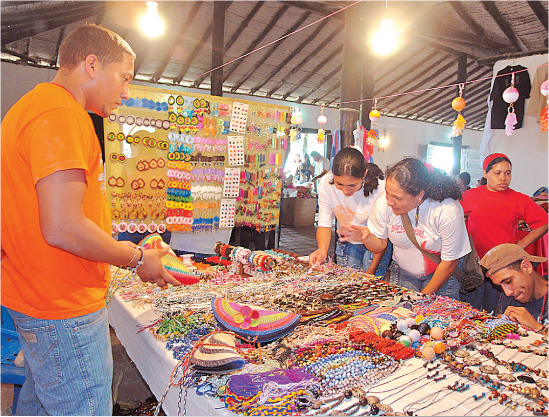
Los artesanos realizarán diferentes concursos y se premiará a los ganadores el sábado 3 de diciembre.

También informó que están participando aproximadamente 450 personas provenientes de los nueve municipios