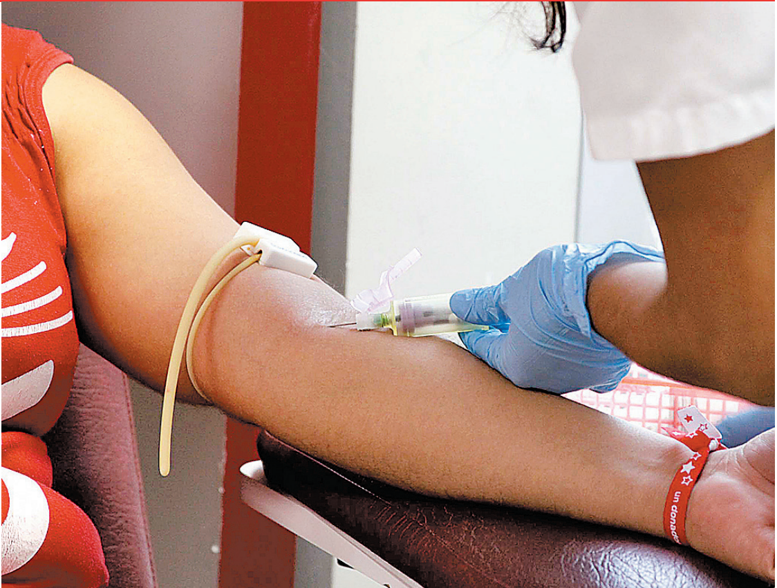
La Organización Mundial de la Salud recomienda hacerse el examen de sangre dos veces al año.