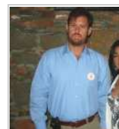
Preventa Sun Chann