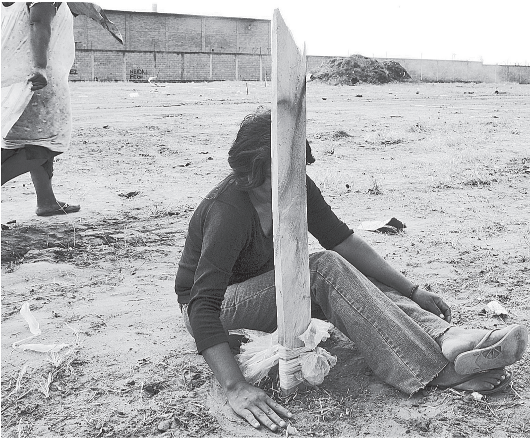
Acusan al Ejecutivo nacional de demarcar a su conveniencia para reservar al Estado las tierras ricas en minerales

Excusó el retraso de diez años en el trabajo de la comisión gubernamental y en la entre-