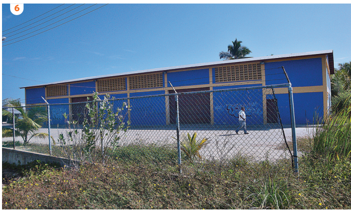
1. Los invernaderos de San Mateo no están produciendo | 2. La Aldea de Pescadores avanza a paso lento | 3. El NUDE de Maurica está en litigio catastral | 4. Del NUDE de Guanta únicamente existen las bases | 5. Sólo vigas quedaron del proyecto avícola de El Tigre | 6. El núcleo Rincón de Uchire nunca ha abierto sus puertas