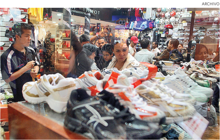
Cientes denuncian que los robos ocurren aunque haya mucha gente en el lugar