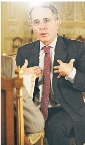
Ex presidente de Colombia