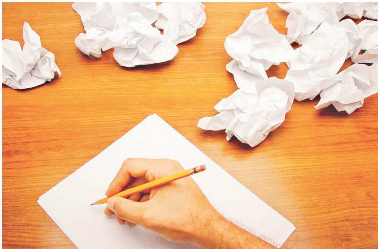
Poetas esperan una legislación que resguarde su trabajo

“Tuve la oportunidad de explicar ante el Concejo por qué es necesario que se apruebe una legislación que obligue a los municipios a otorgar cada año el Premio Municipal de Poesía. No tenemos una ley que los obligue a darlo. A