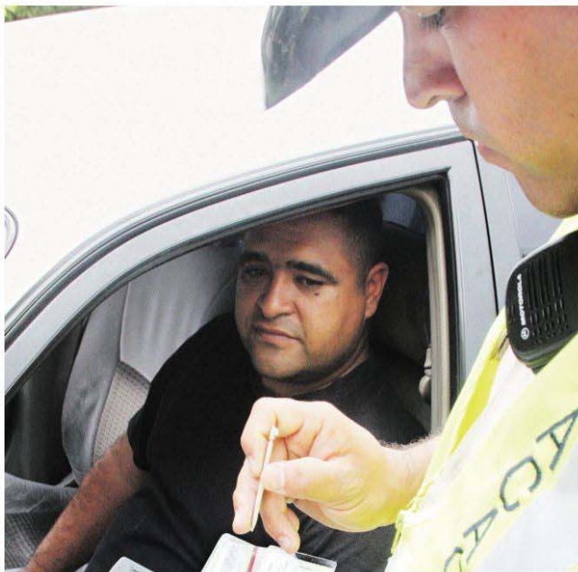
El Plan 4 Ruedas busca capturar vehículos que transiten por Chacao y que estén solicitados por robo

Desde inicios de este mes, los Polichacao comenzaron a aplicar el Plan 4 Ruedas, que consiste en operativos de despliegue sorpresa aplicados en avenidas, calles, estacionamientos techados y a cielo abierto, con el objetivo de localizar carros que se encuentren aparcados por mucho tiempo sin explicación legítima o conducidos por personas